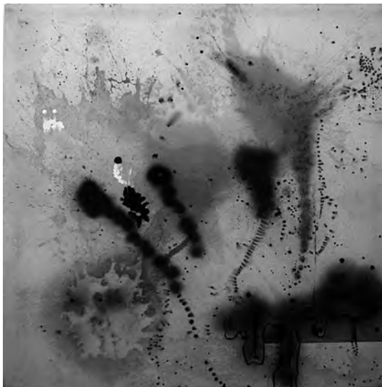
Rodríguez Larrain, E. (2006). Sin título .