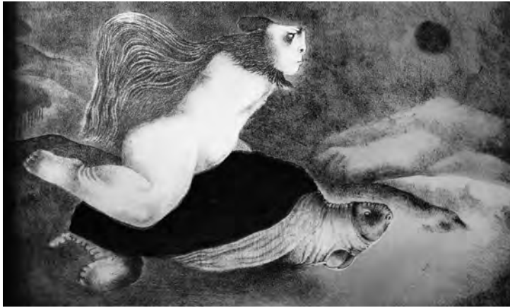
Tsuchiya, T. (1974). El mito de los sueños .